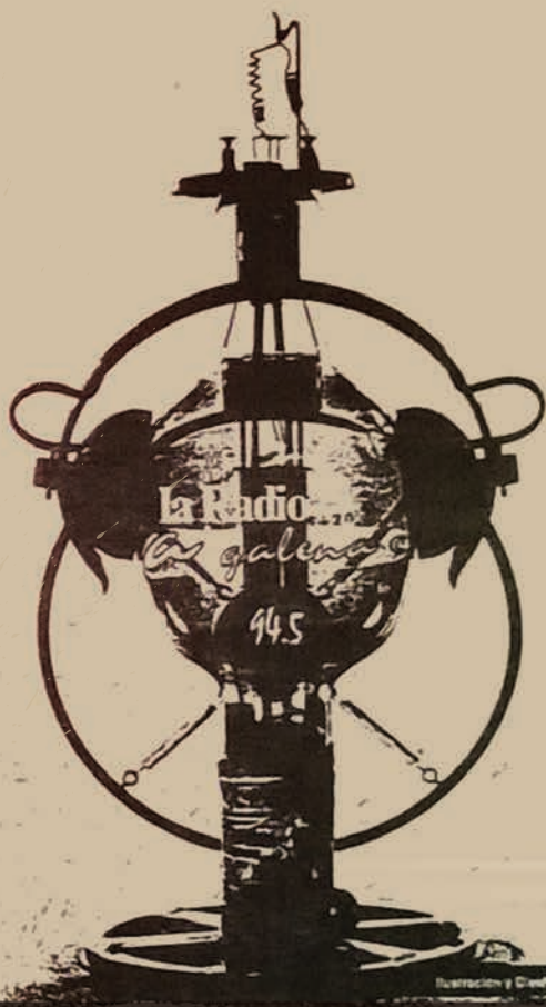
Ilustración y Diseño: Martín Frensch / FIC 22022

¿Pero cuál fue el legado de la Galena? Ya que si la googleás no aparece y prácticamente no hay registros de ningún tipo. Si reconocemos que la radio condensa el sentido de lo efímero, su continuidad debe estar en esa tribu de radialistas y escuchas que intercambiaron sentidos, experiencias, noches y días de búsquedas al borde del camino.