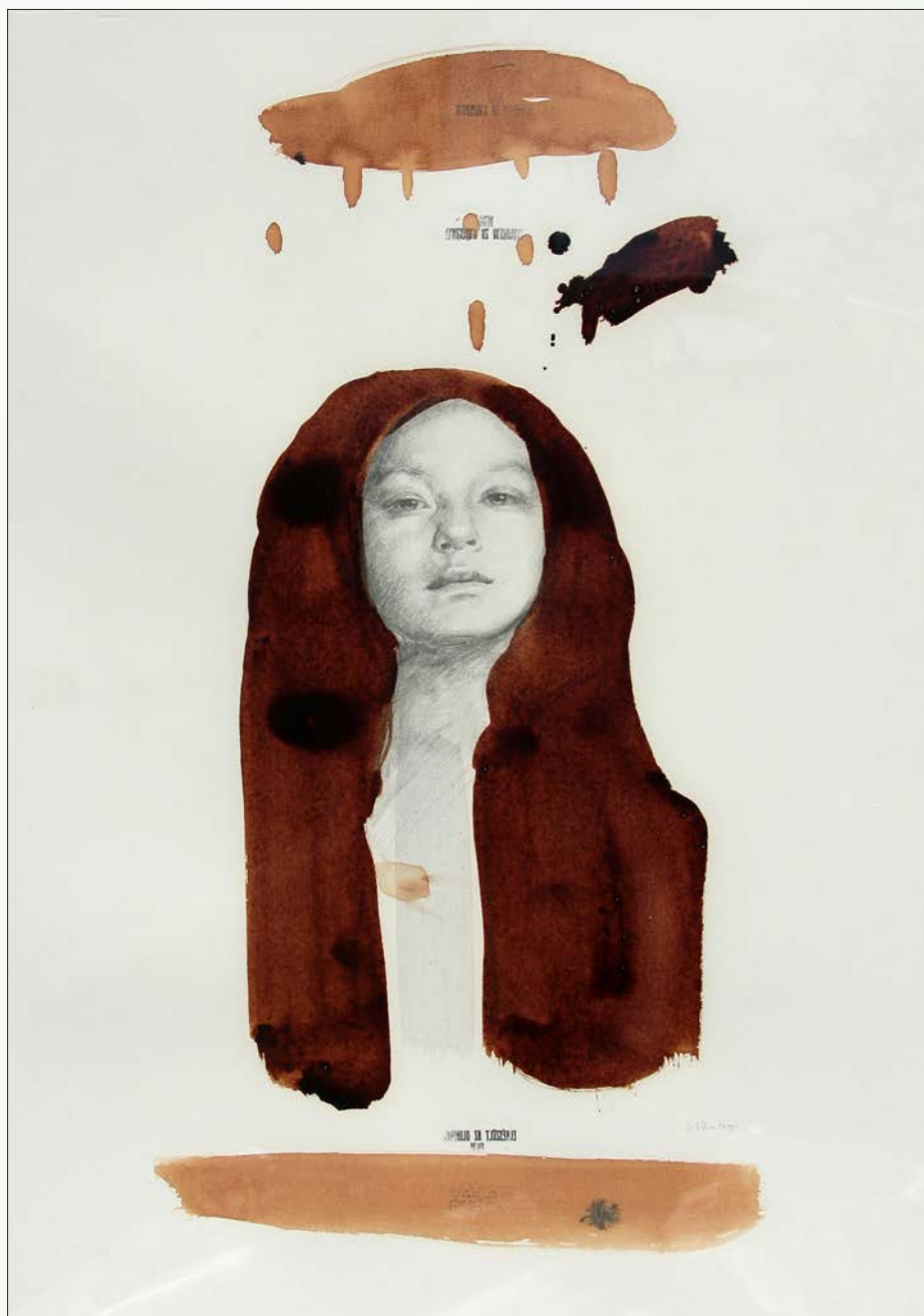
Viaje en bote. Técnica mixta sobre lienzo, 140 cm x 80 cm, 2012