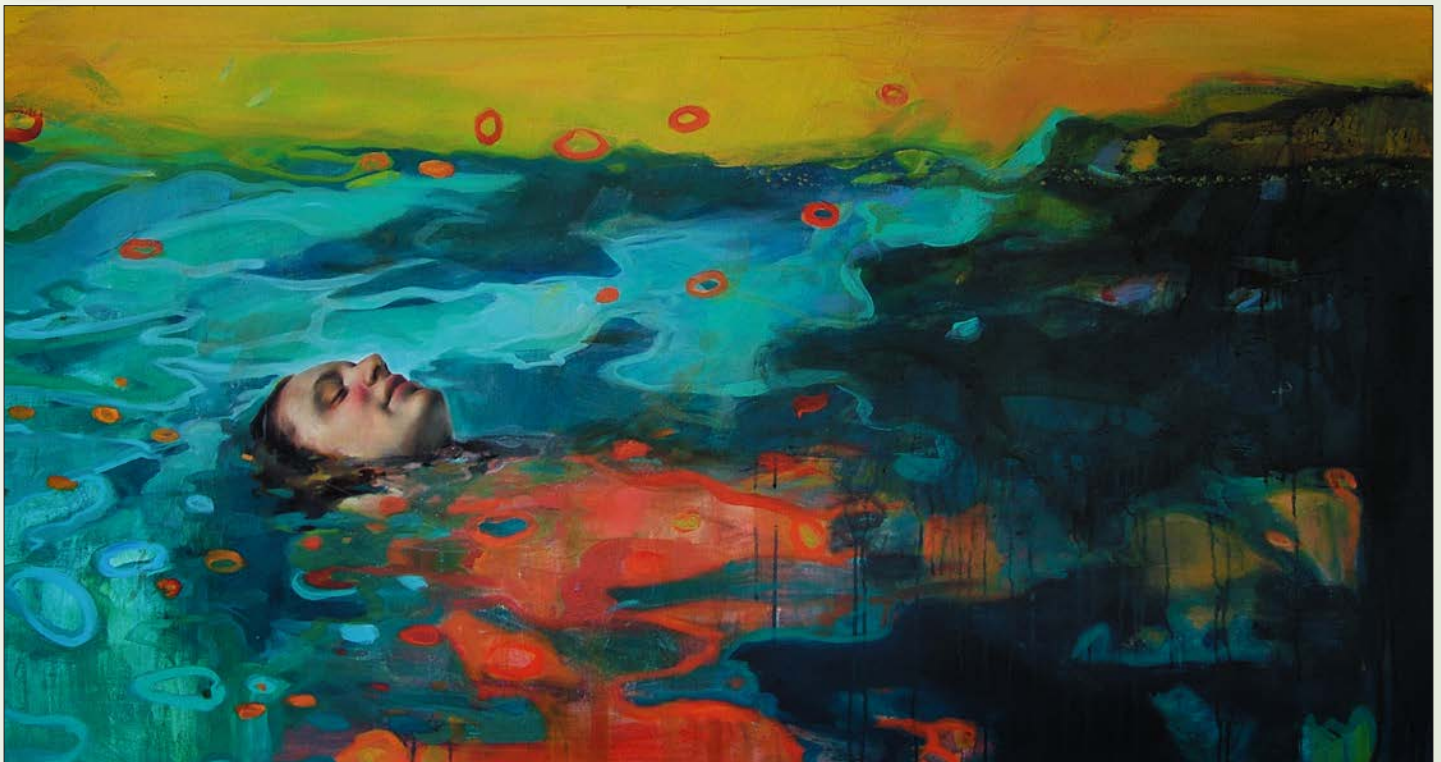
Sueño de agua. Técnica mixta sobre lienzo, 150 cm x 80 cm, 2007