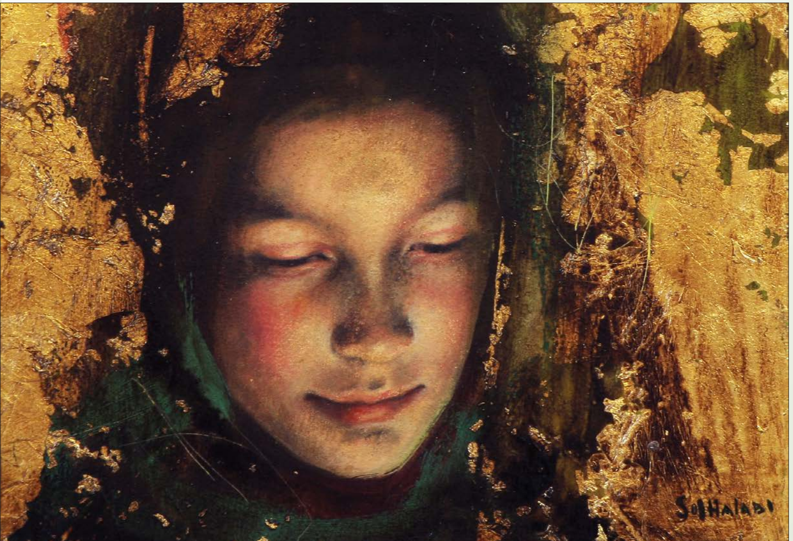
El fuego es paz. Técnica mixta sobre lienzo, 14 cm x 24 cm, 2011

Mujeres y niñas que protagonizan parte de la obra de Sol Halabi asaltan las páginas de LaCentral para sumergirnos en un espacio sin tiempo o, al menos, en un tiempo difícil de identificar.