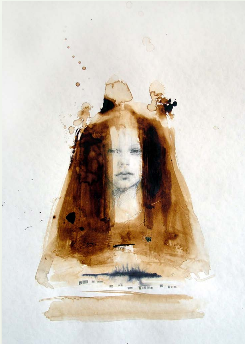
Niña mundo. Técnica mixta sobre papel, 70 cm x 50 cm, 2006