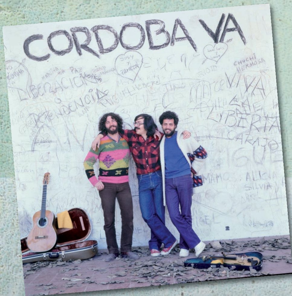
Foto de tapa alternativa